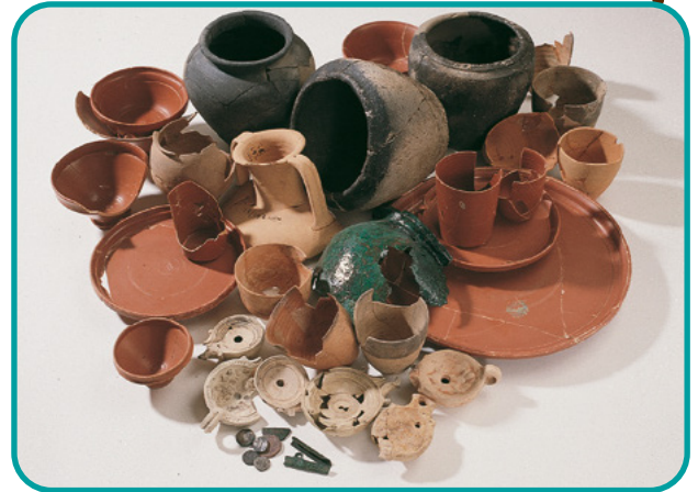
Romeins aardewerk - Museum Het Valkhof

Op plekken waar de Romeinen hebben gewoond, vinden archeologen vaak heel veel scherven van aardewerk. Aardewerk is gemaakt van klei. Bijvoorbeeld van bekers, borden, olielampjes, kannetjes en kruiken. Soms hebben archeologen geluk en vinden ze een heleboel tegelijk, zoals op de foto hiernaast. Waarschijnlijk hebben een stel rijke Romeinen een feestmaaltijd gehad en hadden ze daarna geen zin in de afwas en hebben ze alles tegelijk weggegooid. Deze hele berg aardewerk is namelijk bij elkaar teruggevonden in de kuil van een latrine. Een latrine is een wc.